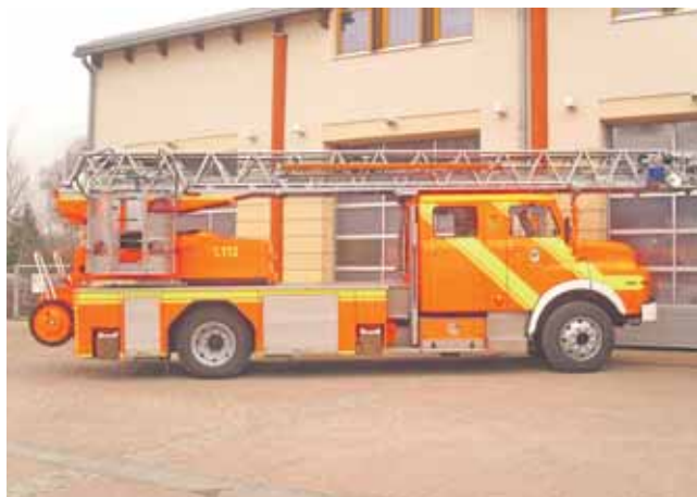
1996 konnte diese ausgediente Drehleiter von der Berliner Feuerwehr für die Wehr Fredersdorf-Süd erworben werden.