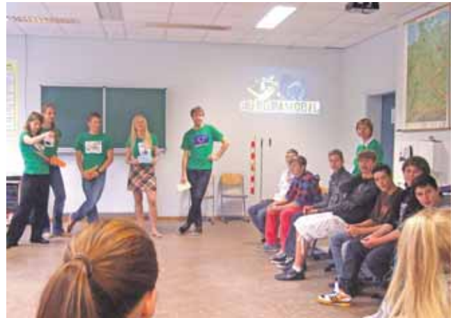
20 Studenten aus 11 europäischen Ländern gestalteten mit den Schülern einen interaktiven Workshop in englischer Sprache.

Europamobil brachte Schülern das Konstrukt EU nahe