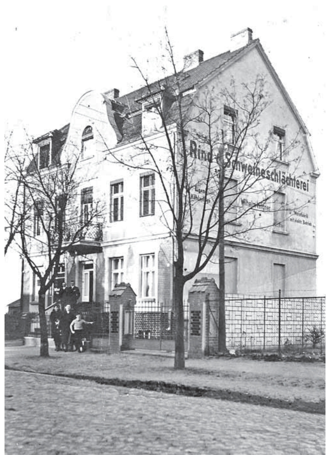
Das Gebäude in der Langen Straße 3 beherbergte zunächst eine Fleischerei, ehe nach der Wende die HO einzog.

Rind- und Schweineschlächterei in der Langen Straße