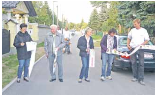
Gemeinsam haben Anwohner, Gemeindevertreter, Verwaltung und Baufirma symbolisch die Straßen wieder freigegeben.