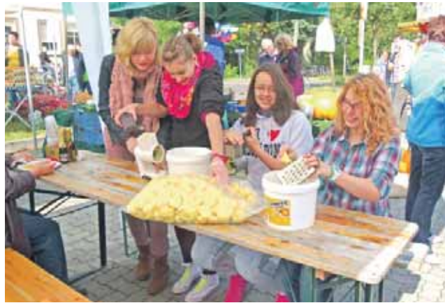
Die Mädels der Oberschule Fredersdorf rieben den ganzen Tag fleißig Kartoffeln für die frischen Puffer- dem Verkaufsschlager schlechthin.