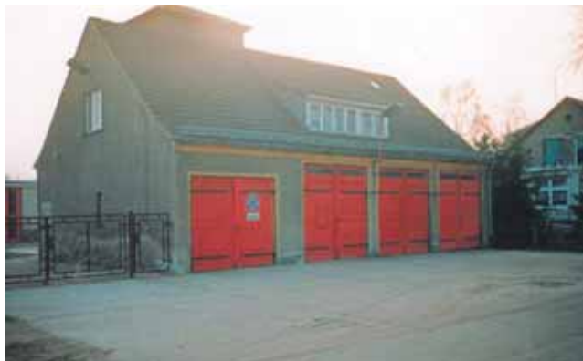
Das alte Gerätehaus wurde 1999 abgerissen. Am selben Standort wurde das neue Gerätehaus mit mehr Platz und Stauraum errichtet.