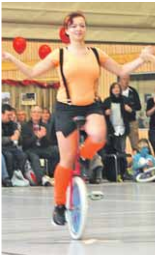
Die Einradtruppe Fredersdorf-Vogelsdorf veranstaltete eine große Sportgala und zeigt ihr Können.