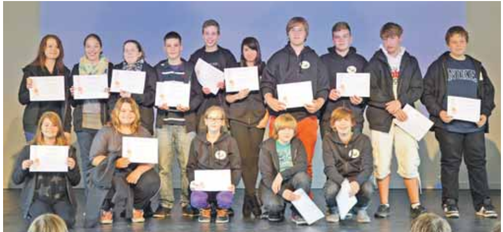
Nach einem mehrtägigen professionellen Workshop, in dem die Jugendlichen das richtige Schlichten erlernten, können sie sich ab sofort „Streitschlichter“ nennen.

15 Schüler der Oberschule sind ab sofort als zertifizierte Streitschlichter unterwegs