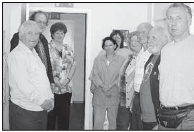
Besichtigung der Kindertagesstätte durch den Bildungs- und Sozialausschuss

(wt) Der Ausschuss für Bildung und Soziales traf sich zu seiner turnusmäßigen Sitzung in der Kindertagesstätte in der Loosestraße. Die Mitglieder des Ausschusses nahmen Informationen über die Tätigkeit des Katharinenhofs am Dorfanger