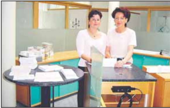
Am 19. Juli wurde der Teilbereich Kundenraum für die Kunden eröffnet. Hier ein Foto kurz vor Fertigstellung der Arbeiten mit zwei Mitarbeiterinnen bei den letzten Vorbereitungen.