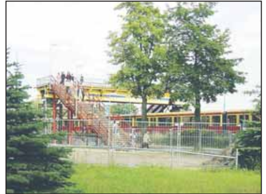
Eine Behelfsbrücke ermöglicht bis zur Inbetriebnahme der neuen Brücke den Zugang zum Bahnhof