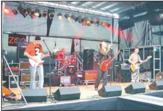
Die U2-Cover-Band „ZOO-TV“ bei ihrem Auftritt am Bötzeesee

(wt) Das Konzert „Rock am See“, organisiert von den Rolling Wheels des MC Strausberg, erlebte am 26. Juni seine 4. Auflage und wurde zu einem Publikums-magneten. Bei idealem Wetter und vor der schönen Kulisse des Bötzees begeisterten die U2-Cover-Band