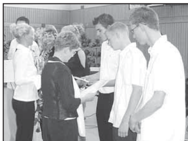
Die Zeugnisübergabe ist immer ein Höhepunkt im Leben einer Schule