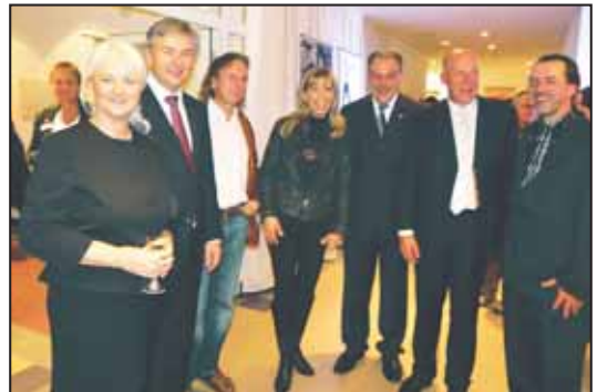
Der Regierende Bürgermeister Klaus Wowereit mit Premierengästen im Katharinenhof im Schlossgarten