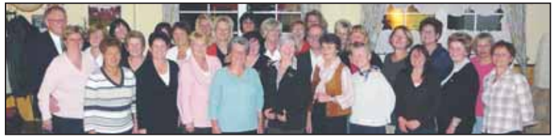
Die Gymnastikfrauen mit Prominenz