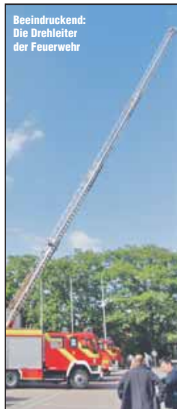
Beeindruckend: Die Drehleiter der Feuerwehr