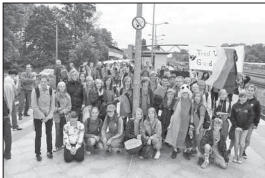
Der S-Bahnhof Fredersdorf wurde von der fröhlichen Schar der Schüler in Beschlag genommen

tung ihrer Lehrer und Eltern und des Bürgermeisters Dr. Uwe Klett ging es zum Berliner Olympiastadion. Die Fredersdorf-Vogelsdorfer waren im Publikum gut auszumachen, denn die gesamte Truppe trug das rote T-Shirt mit dem Fred-Vogel, dem Maskottchen der Schule.