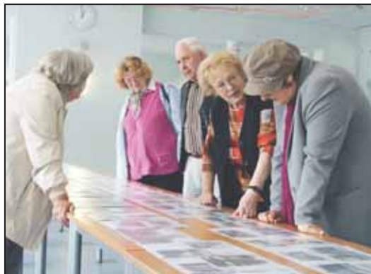
Fachsimpeln in der Bilderausstellung von Familie Keller

schönen Wetter Platz. Das Florianfest lockte wiederum zahlreiche Feuerwehrfans und Gäste an. Sowohl die moderne Einsatztechnik als auch die historischen Fahrzeuge standen immer wieder im Mittelpunkt des Interesses.