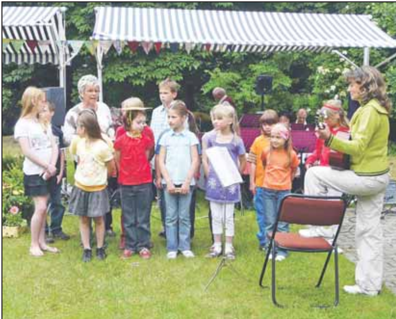
Die Kinder des Hort I überbrachten musikalische Grüße zum Fest