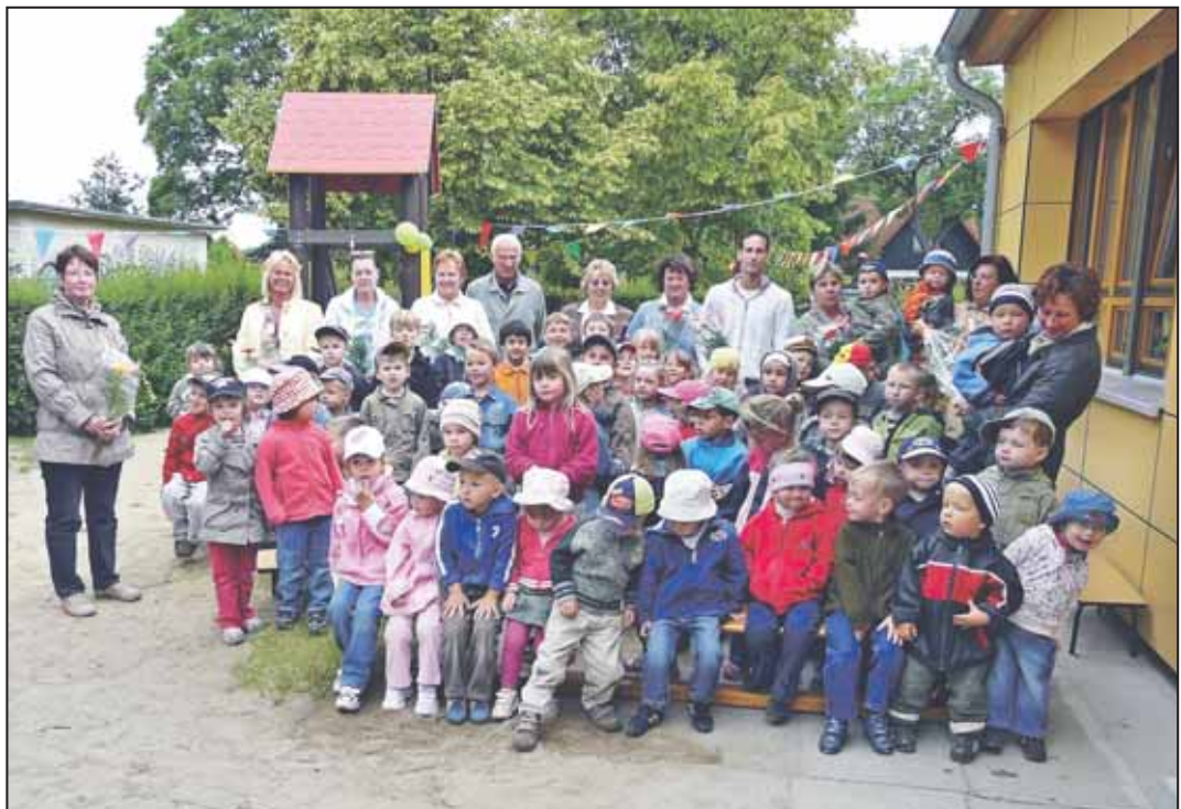
Das Team der Kita „Else Kühne“ feierte Geburtstag

(wt) Am 3. Juni begingen die 60 Kinder und acht Mitarbeiter der Kindertagesstätte „Else Kühne“ in Fredersdorf Nord den 20. Geburtstag ihrer Einrichtung mit einer zünftigen Festwoche.