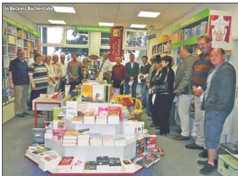
In Beckers Bücherstube

Abschließend erläuterte Bürgermeister Dr. Uwe Klett die Vorstellungen der Verwaltung zum Einsatz der Mittel aus dem Konjunkturpaket II.