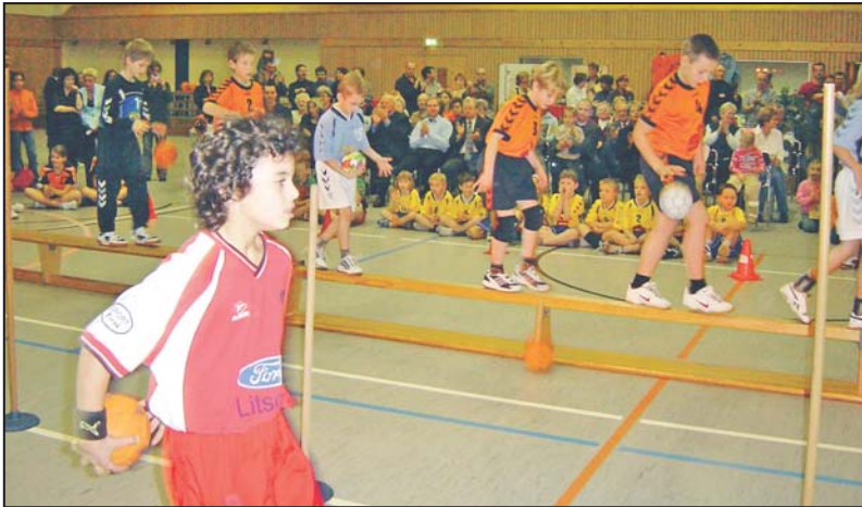
Die Handballer zeigten Proben aus der Trainingsarbeit