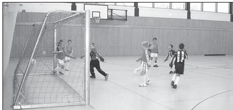
Im Spiel der beiden TSG-Mannschaften ist das 4:0 für die TSG I gefallen