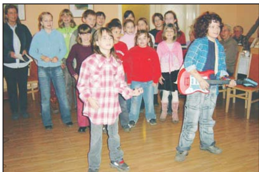
Zur Weihnachtsfeier der Gemeinde traten Schülerinnen und Schüler mit einem bunten Programm in der Begegnungsstätte auf

Schülerinnen und Schüler führten als Höhepunkt des Abends das Stück „Die Jahresuhr“ auf. In den Wandelgängen der Schule warteten Bäcker und Imker mit einem kleinen Weihnachtsmarkt auf.