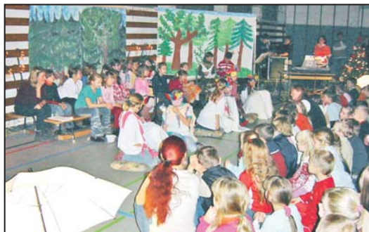
Weihnachtskonzert in der zweiten Grundschule