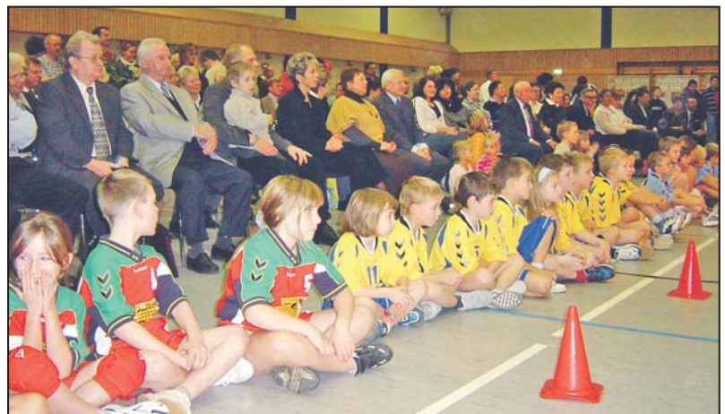
Aufmerksam verfolgten Gäste und Akteure die Vorführungen