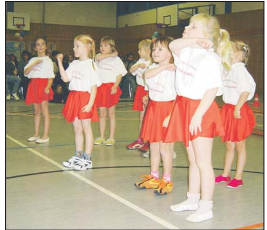
Die kleinen Tänzerinnen erfreuten das Publikum mit ihren Darbietungen