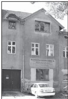
Der Colonialwarenladen von Alexander Schwengler Das Gebäude in der Gegenwart