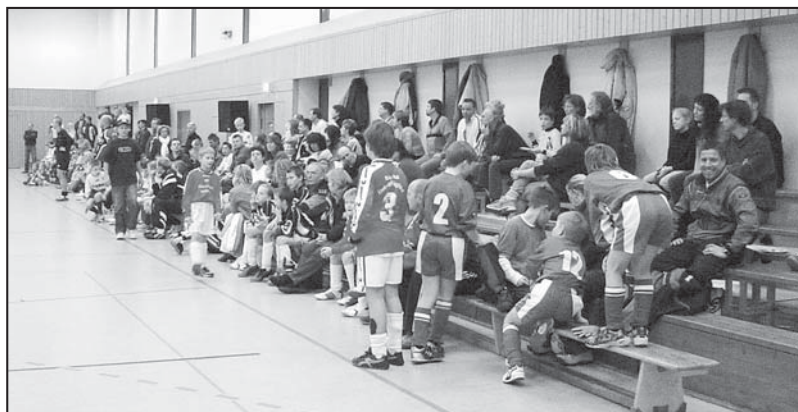
Auf den Rängen herrschte eine tolle Atmosphäre