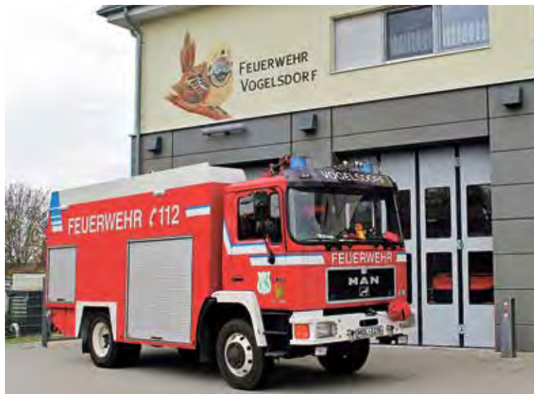
Das Tanklöschfahrzeug TLF 16/45, Baujahr 1996, ist unter anderem mit einer Seilwinde, einem Lichtmast und einem Schaumtank ausgestattet.