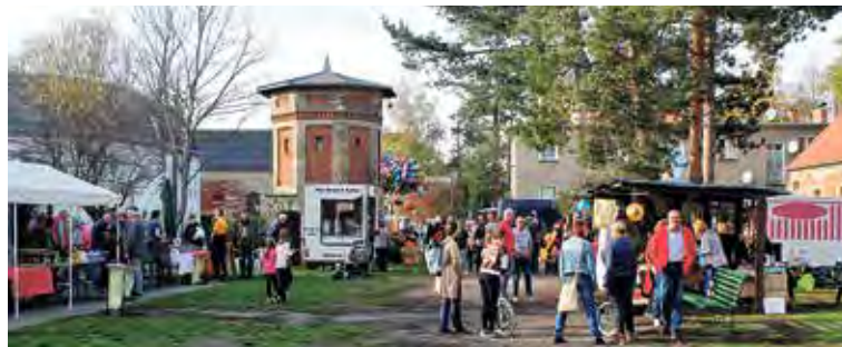
So sah es kurz nach Eröffnung des Kürbisfestes auf dem Gutshof aus – bis zum Abend kamen rund 1.000 Besucher.