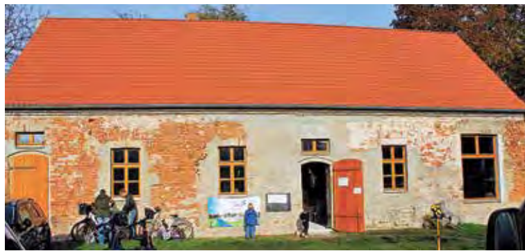
Die äußere Hülle des denkmalgeschützten Gebäudes ist wieder hergestellt – jetzt soll der Innenausbau beginnen.