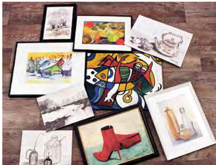
Eine Auswahl an Kunstwerken der neuen Ausstellung „Allerlei Art“, die Mitglieder der Mal- und Zeichengruppe Art Fredersdorf-Vogelsdorf gestalten.