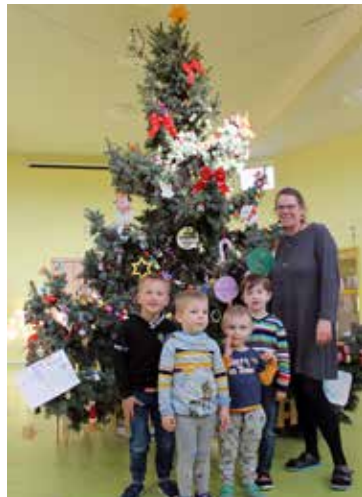
Kita Krümelbude 2.0