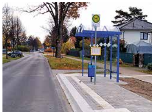
Bollendorfer Allee – Richtung S-Bahnhof Fredersdorf