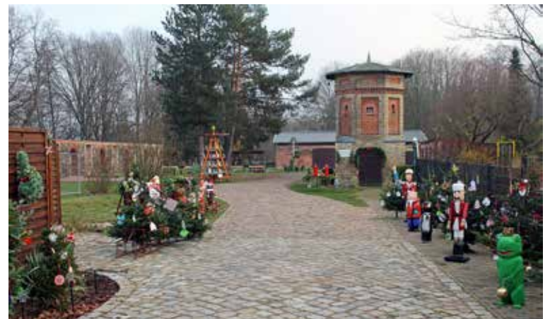
So präsentiert sich der Gutshof in diesen Tagen.