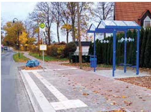
Bollendorfer Allee – Richtung Neuenhagen

nun für ein bequemes Ein- und Aussteigen sorgen. Für die Herstellung konnten anteilig Fördermittel des Landkreises Märkisch-Oderland in Anspruch genommen werden.