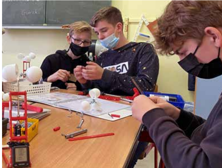
Achtklässler der Oberschule Fredersdorf löteteten, schraubten und bohrten – entstanden sind eigene Energiemodelle.

Und dann ging es an die Lösung der Aufgabe: Entstehen sollten Computer-Anemometer, Mini-Windräder und Kurbelleuchten. Genug Baumaterial und Messkoffer hatte das EWE-Team im Gepäck. Begeistert schraubten, bohrten und löteteten die Mädchen und Jungen. „Es hat Spaß