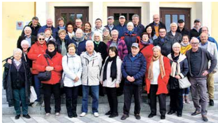
Vor dem Rathaus: Gruppenfoto aller Teilnehmer aus Marquette und Fredersdorf-Vogelsdorf vor der Abreise am Sonntag

Der Partnerschaftspokal ging an ein deutsch-französisches Team, aber auf dem Treppchen stand auch ein deutsch-polnisches Team. Das gesamte Treffen ließ aber auch viel Zeit für persönliche Unterneh-