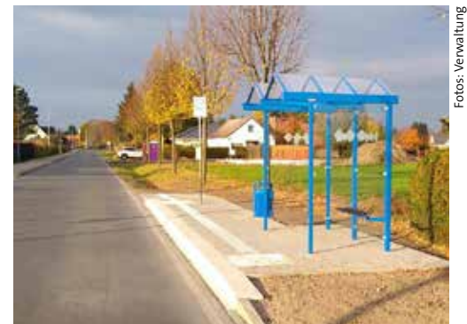
Goethestraße – Haltestelle Höhe Sebastian-Bach-Straße