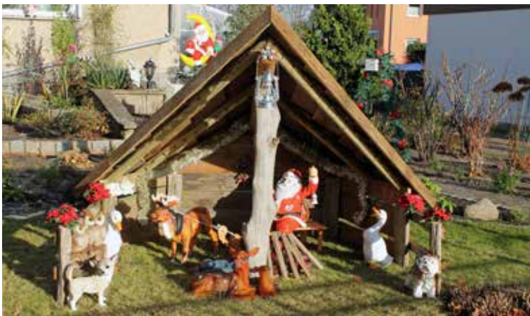
Ein neuer Hingucker auf dem Grundstück der Familie Schimming.