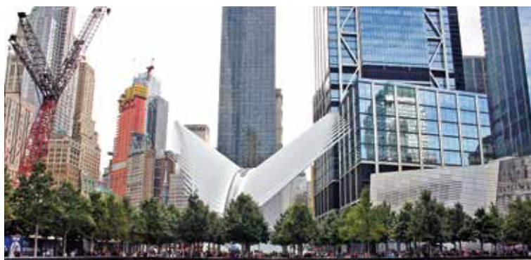
An die Terroranschläge vom 11. September 2001 erinnert in New York das Ground Zero. Zum Gedenkort gehört auch ein Hain aus amerikanischen Roteichen – den Friedenseichen. Touristen nehmen sich jedes Jahr im Herbst Eicheln mit in ihre Heimatländer und bringen die Friedensbotschaft auf diese Weise in die ganze Welt