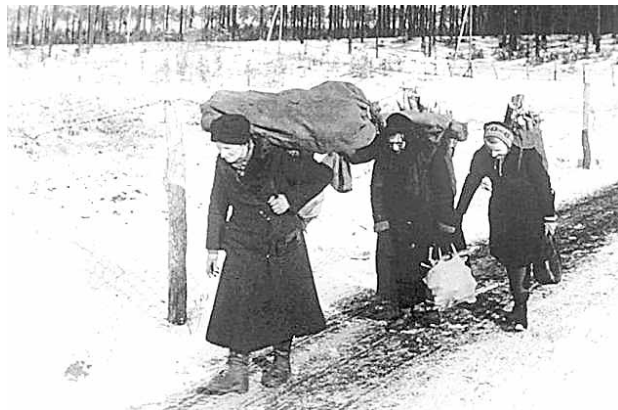
Auf Hamsterfahrt Winter 1946

Zum Ende des Jahres 1946 war in Deutschland (wie auch in den vielen kriegszerstörten europäischen Ländern) kein Aufschwung in Sicht, der Wiederaufbau ließ auf sich warten. Der von Hitler-Deutschland zu verantwortende Zweite Weltkrieg war an seinen Ausgangspunkt zurück gekommen: Etwa 1,35 Mio. Tonnen Bombenlast waren auf Deutschland niedergegangen, schätzungsweise 20 Mio. Menschen lebten in Ruinen, das Leben der deutschen Bevölkerung verlief unter drakonischer Kontrolle der Alliierten, die Deutschland unter sich aufgeteilt hatten. Die Lebensmittelversorgung war äußerst streng rationiert, Deutschland sei nicht besetzt worden „zum Zwecke seiner Befreiung, sondern als besiegtter Feindstaat“, gab eine Direktive für Offiziere der US-Besatzungsmacht die Behandlung der deutschen Bevölkerung vor. Erst im Sommer 1946 ließen die Alliierten Hilfslieferungen aus anderen Ländern zu. Und selbst diese Lieferungen erreichten kaum ihre Ziele, war doch die Infrastruktur zusammengebrochen und die öffentlichen Verwaltungen extrem in Mitleidenschaft gezogen. Die Menschen hatten oftmals nicht das Notwendigste zum Überleben. Dazu kamen die Ströme der Vertriebenen aus den Ostgebieten und die zurückkehrenden Kriegsgefangenen, die ebenso versorgt werden mussten. Das tägliche Leben vor allem in den zerbombten Städten war nun schon seit Mona-