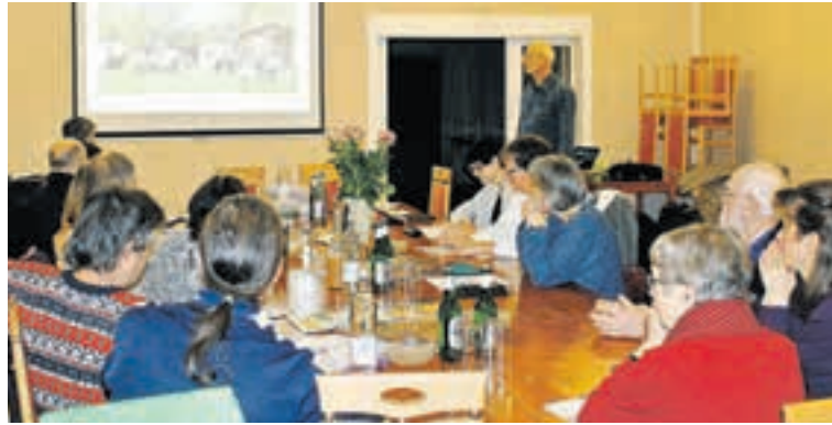
Rückblick auf 2019 – es wurde wieder eine Menge erreicht

Als größte Erfolge 2019 nannte er die Entscheidung, dass die geplante Oberschule nicht im Naturschutzgebiet in Vogelsdorf entsteht. Außerdem gelang es auch durch den Protest der NABU-Ortsgruppe, die Fäll-