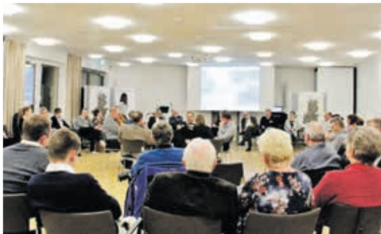
Bürgerdialog – Expertenrunde am 15. Januar 2020

Nachdem es vor einem Jahr zu diesem Thema bereits eine öffentliche Auftaktveranstaltung gab, fand kürzlich ein erster Workshop mit 60 geladenen Gästen aus der Kommunalpolitik, den ehemaligen Beiräten, aus Vereinen, sowie mit Behördenvertretern, Vertretern von Infrastrukturunternehmen und Projektentwicklern statt. Es wurden verschiedene Themen der Siedlungs-, Freiraum- und Verkehrsentwicklung, wie unter anderem die gewerbliche Entwicklung an der B1,