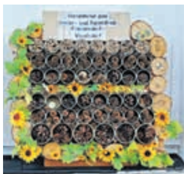
Bienenhotel von den Kindern gebaut

die Angebote des Jugendklubs präsentiert. „Wir laden sie ein, machen sie neugierig und zeigen ihnen, dass die Tür in der Waldstraße 26 immer für sie offen steht“, betont die Leiterin.