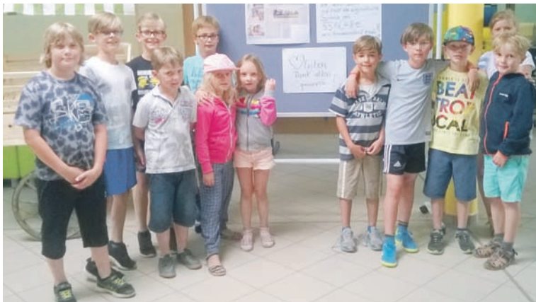
Richtig stolz auf die erlaufene Spendensumme: Mädchen und Jungen Fred-Vogel-Grundschule.