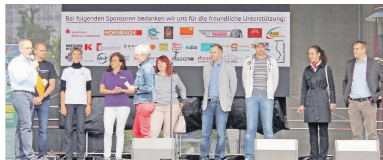
Ohne sie wäre das Brückenfest so nicht möglich: Einige Vertreter von Sponsoren und Spendern folgten der Einladung des Bürgermeisters zur Eröffnung auf die Bühne.