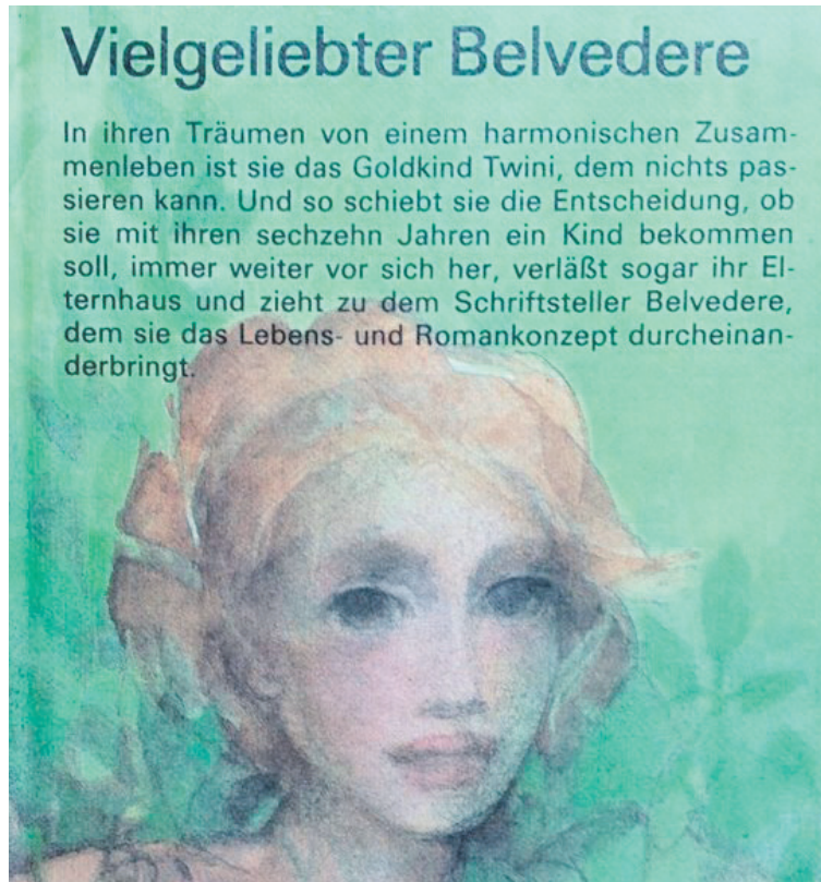
Das Buchcover: Der Roman „Vielgeliebter Belvedere“ kann in der Gemeindebibliothek, Waldstraße 26/27 ausgeliehen werden.