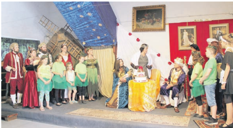
Begeisterten am neuen Spielort: Die Darsteller des Theaterkreises Traumland feierten eine gelungene Premiere ihrer Märcheninszenierung.

Gelungene Premiere von „Rumpelstilzchen neu erzählt“ im Speicher der evangelischen Gemeinde