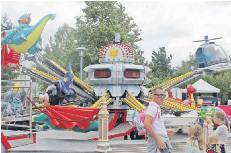
Buntes Rummeltreiben: Verschiedene Fahrgeschäfte zogen vor allem die kleineren Gäste des Brückenfestes magisch an.