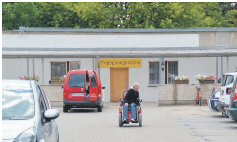
Beliebt, aber keine Schönheit: Über die Begegnungsstätte in der Waldstraße will der Bürgermeister eine Diskussion anregen.