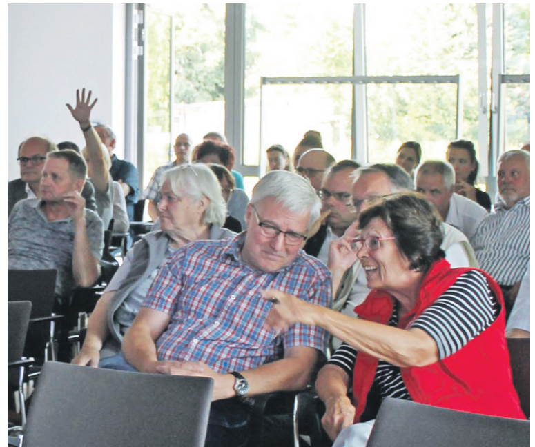
Engagiert und interessiert: Etwa 60 Bürger der Gemeinde hatten sich auf den Weg gemacht, um mit dem Landrat ins Gespräch zu kommen.

Der Heimatverein hofft auf finanzielle Unterstützung des Landkreises bei der weiteren Sanierung des Gutshofs. Voraussetzung dafür sei beispielsweise ein wöchentlicher Markt mit ländlichen Produkten aus der Region. Thematisiert wurde ebenfalls die unbefriedigende Situation auf dem Bolzplatz an der Landstraße in Fredersdorf Nord. Anwohner fordern von der Gemeinde und vom Kreis Hilfe bei der Sicherstellung von Ruhe und Ordnung. „Wir haben es mit einer dauerhaften Lärmbelästigung zu tun,