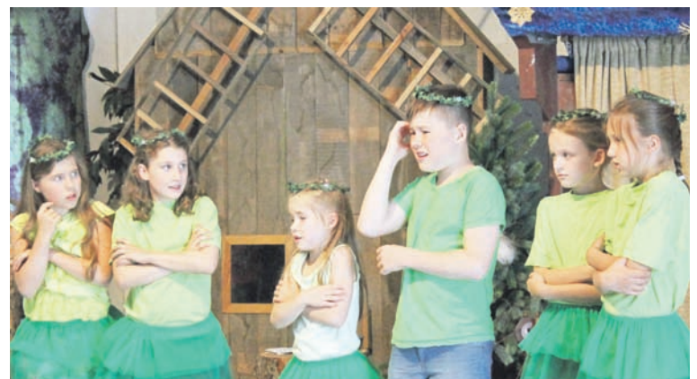
Bekamen Szenenapplaus: Die Waldkinder sorgten mit für den guten Ausgang des neu erzählten Märchens.

Die gelungene Auftaktveranstaltung sollte dem Ensemble nun einen positiven Schub geben. Die vergangenen Monate waren nicht einfach für die Gruppe. Im Dezember starb die bisherige Darstellerin des Rumpelstilzchens. Zudem erkrankte ein weiterer Mitspieler schwer.