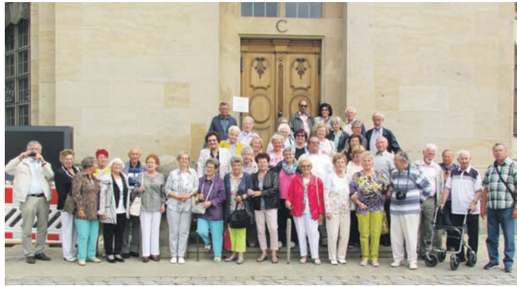
Fredersdorf-Vogelsdorfer Senioren unterwegs: Nach Dresden führte die Reise während der Brandenburgischen Seniorenwoche.