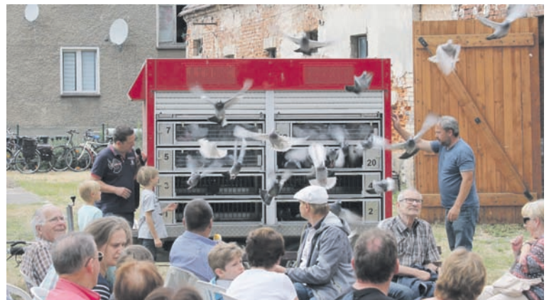
„Immer wieder ein wunderschöner Moment“: Mitglieder des ortsansässigen Vereins Gut-Flug-Ost schickten ihre Tauben auf die Reise.