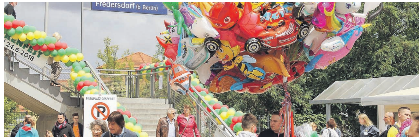
Bahnhof mal anders: Zwei Tage lang wurde das Brückenfest gefeiert, mit Angeboten für alle Generationen. Das bereits vierte Fest zog tausende Besuche an und machte Lust auf das kommende Jahr.