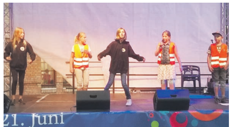
Rappten in Berlin für ein friedliches Miteinander: Die Streitschlichter der Fred-Vogel-Grundschule und der Grundschule Am Dorfanger Petershagen.