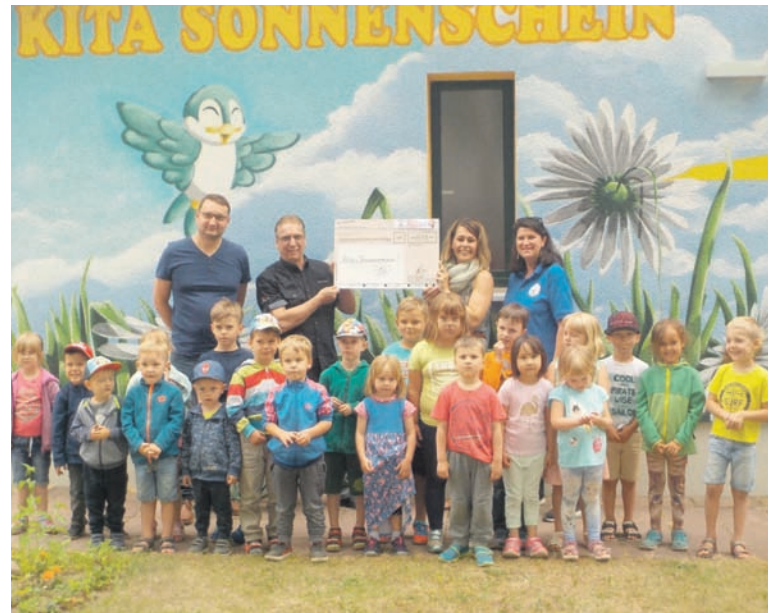
Freude über 873 Euro: Die Jungen und Mädchen der Kita Sonnenschein profitieren vom Fest in der Verdrießstraße.

Am Freitag, 15. Juni 2018 konnten sich die großen und kleinen Sonnenscheine in Vogelsdorf über eine ganz besondere Geldspende freuen. Sie bekamen einen Scheck in Höhe von 873 Euro überreicht. Denn als das Straßenfest in der Verdrießstraße stattfand, das vom Eiscafé Eisjunge, von Town & Country und Sebastian's Fahrradladen veranstaltet wurde, kam der Erlös der Tombola der Kita Sonnenschein zu Gute.