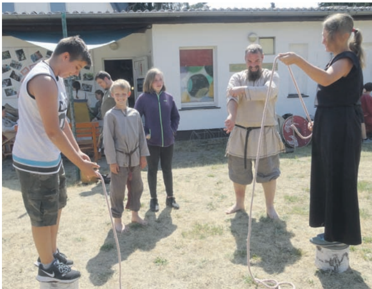
Thementag ohne technischen „Schnickschnack“: Viel über das Leben im Mittelalter war unlängst im Kinder- und Jugendklub zu erfahren.

Bogenschießen, Tauziehen auf Holzklötzen und Wikingerschach ausprobiert werden. Alle waren sich einig - weniger ist oft mehr. Die Menschen damals hatten viel Spaß auch ohne Internet, Spielekonsole, Smartphone oder Fernseher. Berichte über das Leben im Mittelalter wirken nachhaltiger, wenn man diese Zeit aktiv ein Stück weit erlebbar macht, was auch ohne technischen „Schnickschnack“ durchaus recht kurzweilig sein kann.