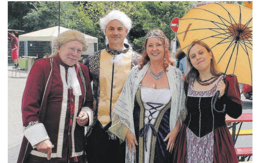
Eine Höhepunkt des Festes: Die Mitglieder des Theaterkreises Traumland waren neben ihrer gelungenen Aufführung auch ein willkommener Hingucker.