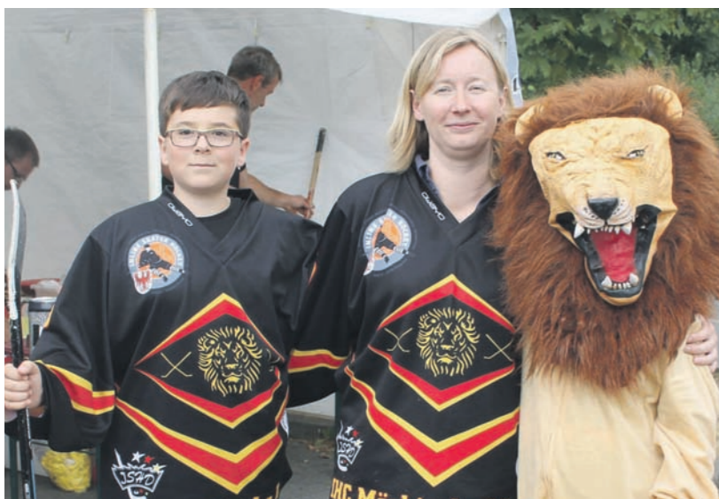
Werbung für Inline-Skaterhockey in Fredersdorf: Auch Mitglieder des IHC Märkische Löwen waren mit ihrem Maskottchen dabei.