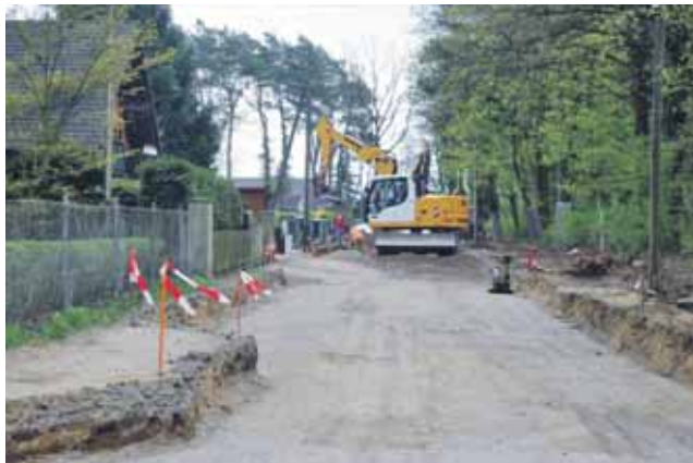
Auskoffering und Aufschotterung der Beppo-Römer-Straße.

Die Bauarbeiten zu den drei Straßen mit einer Gesamtlänge von knapp 1,5 km haben termingerecht im Februar 2016 mit der Bauaufreimung (Fällung der Bäume) begonnen. Nachdem die Medienträger notwendige Um- oder Neuverlegungen der Leitungen abgeschlossen haben, verfügt nun die Baufirma über ein freies Baufeld. Ebenfalls erneuert wird die Straßenbeleuchtung, wofür die Leitungsverlegung im Rahmen der Bauvorbereitungen bereits durch die Firma Elektro Schmidt erfolgte. Während der Arbeiten der Medienträger koferte eine Kolonne der Berger Bau GmbH bereits abschnittsweise die Beppo-Römer-Straße und den