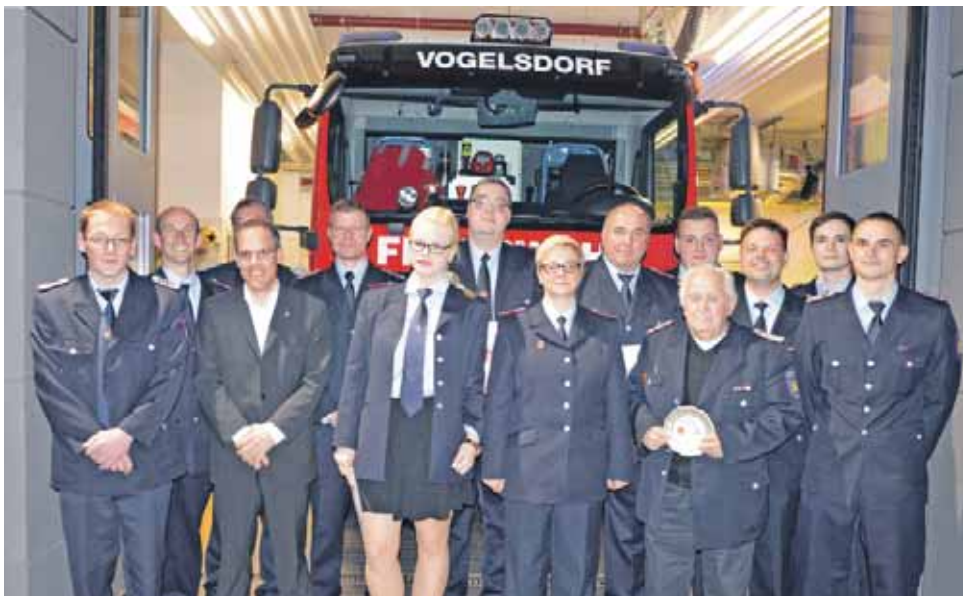
Die beförderten und geehrten Kameradinnen und Kameraden und im Hintergrund der Neuzuwachs der Vogelsdorfer Wehr – das neue HLF 20.

Jahreshauptversammlung der Feuerwehr Vogelsdorf – Neues HLF 20 offiziell vorgestellt