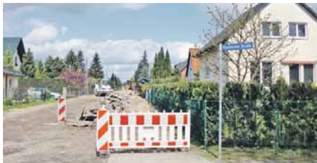
Jahnstraße Q 10 – Abbruch Gehweg.

Fünf Anliegerstraßen und ein Anliegerweg werden seit Anfang April ausgebaut