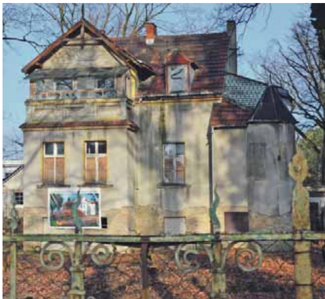
Die Gemeinde sucht jetzt in einem offenen Interessenbekundungsverfahren Investoren und Träger für die Adolph-Hoffmann-Villa.

Interessenbekundungsverfahren veröffentlicht