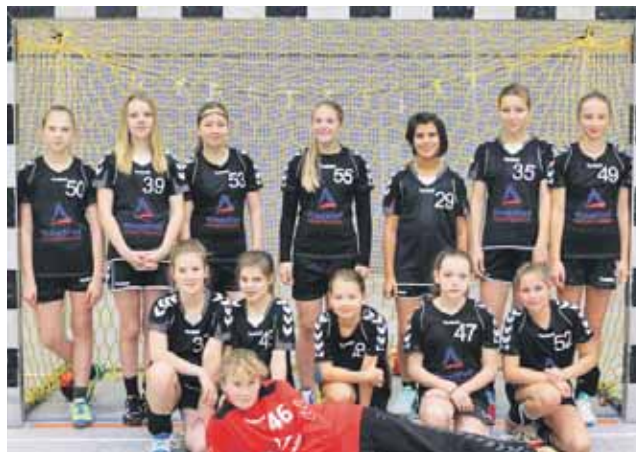
Die D-Jugend Mädels der OSG schlossen die Handballsaison mit einem Sieg gegen Wildau erfolgreich ab.

D-Jugend bestritt letztes Punktspiel der Saison