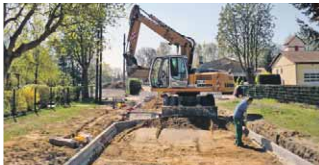
Kantstraße, Q 10, Herstellung Borde für Verkehrsberuhigung.

mulden. Zufahrten und Zugänge werden gepflastert und in den Seitenbereichen entstehen ausgedehnte Grünflächen. Auch neue Bäume werden gepflanzt, soweit dafür ausreichend Platz vorhanden ist. Die Straßenbeleuchtung mit Stromversorgung über eine Freileitung wird ebenfalls erneuert, hier entstehen moderne, energieeffiziente LED-Lichtpunkte. Die Leistungen der Medienträger, Wasser, Gas und Elektroenergie wurden im Vorhinein so koordiniert und zeitlich eingebunden, dass der Straßen-