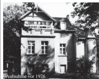
Aufnahme vor 1976